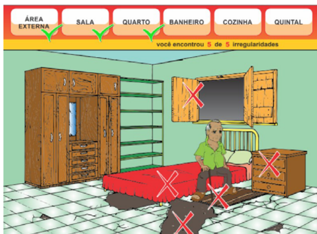
Figura 2. Irregularidades marcadas no cenário.

Ao serem identificadas todas as irregularidades de uma determinada área, aparecia um “check” em verde (figura 2), localizado na área acima da tela. Nesta região, também foram dispostas a quantidade de irregularidades encontradas no cenário. O jogo terminava quando o usuário identificava todas as irregularidades do cenário, de modo que todos os nomes dos cenários ficavam sinalizados com um “check” em verde.